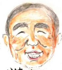
山ちゃんの 映画観ておぼ記