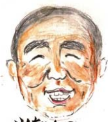
山ちゃんの 映画観ておぼ記