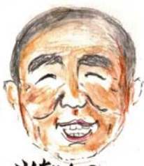
山ちゃんの 映画観てある記