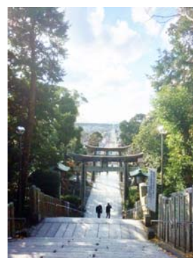
宮地嶽神社「光の道」