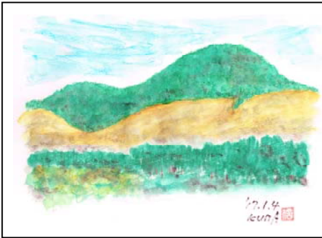
水彩色鉛筆 スケッチブックB5