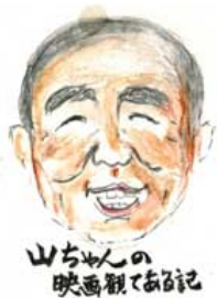
映画大好きの山ちゃんが、毎回、自分の言葉で執筆します。