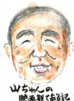
山ちゃん 映画観ておぼろ